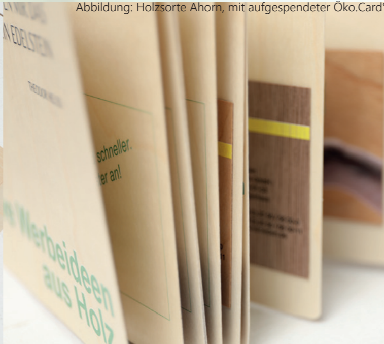
Abbildung: Holzsorte Ahorn, mit aufgespenderter Öko.Card®