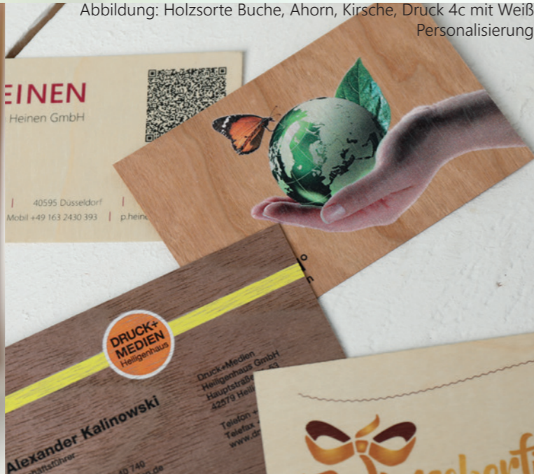
Abbildung: Holzsorte Buche, Ahorn, Kirsche, Druck 4c mit Weiß Personalisierung